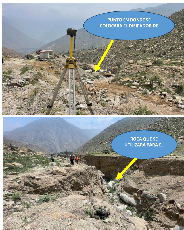
SECTOR QUEDBRADA PASCANA II