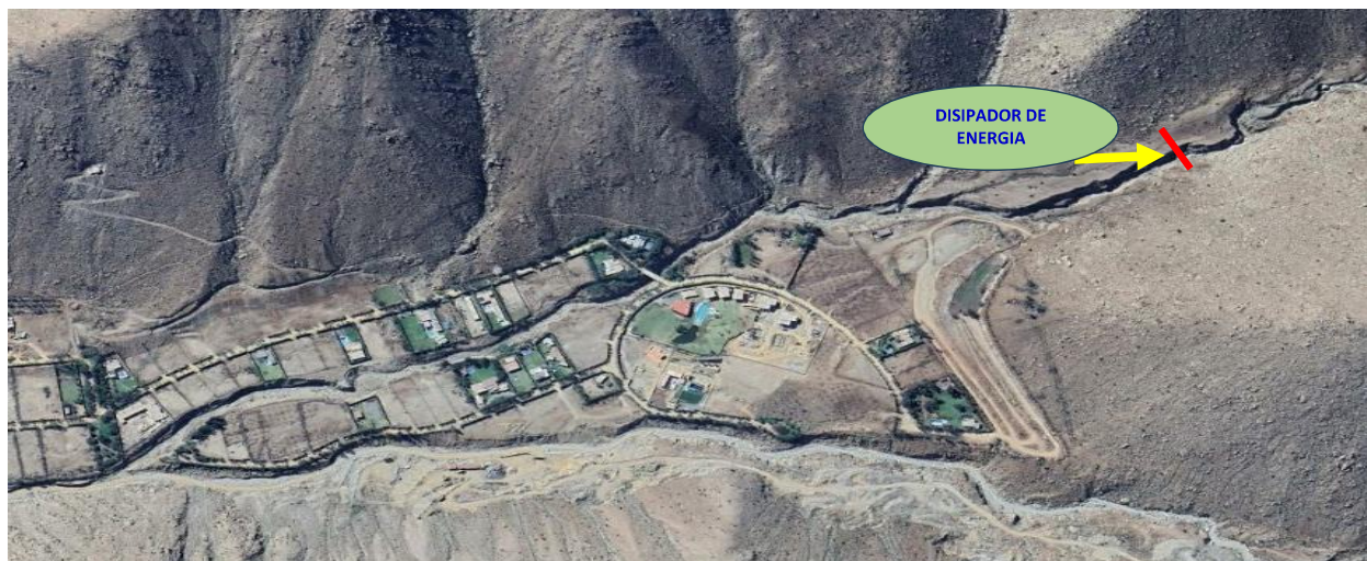
5.- IMAGEN SATELITAL DE ZONA VULNERABLE